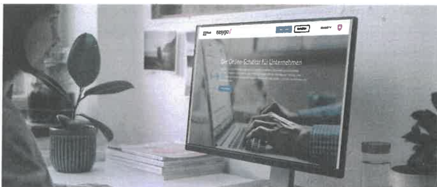
E-Government: Immer mehr Dienstleistungen stehen online zur Verfügung.

Filtermöglichkeiten durchsucht und als PDF heruntergeladen werden. Zudem wird die elektronische Markenmeldung «e-trademark» neu als Teilintegration über EasyGov angeboten. Neben der Anmeldung von Marken lassen sich für bestehende Marken auch Adressänderungen im Register durchführen.