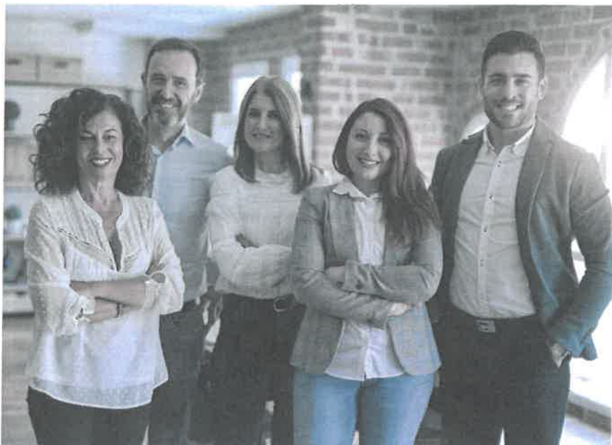
Alles klar: Das Personalreglement schafft eine verbindliche Regelung der Arbeitsbeziehung.

Grundlegender Bestandteil des Personalreglements ist das Arbeitszeitmodell des Unternehmens. Also beispielsweise die gleitende Arbeitszeit mit definierten Blockzeiten, Regelungen zum Homeoffice und die im Betrieb übliche Wochenar-