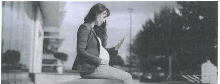
Neben den gesetzlichen Pausen steht Schwangeren alle zwei Stunden eine zusätzliche Pause von zehn Minuten zu.

Die Arbeitnehmerin kann der Arbeit fernbleiben, sie muss aber Bescheid geben. Der Lohn ist nur bei Vorliegen eines Arzzeugnisses geschuldet. Es gelten die gleichen Vorschriften wie bei krankheits- oder unfallbedingten Absenzen. Eine Lohnfortzahlungspflicht besteht, wenn ein unbefristetes Arbeitsverhältnis mindestens drei Monate gedauert hat. Bei einem befristeten Arbeitsverhältnis gilt sie nur, wenn der Vertrag für mehr als drei Monate abgeschlossen wurde. Der Ferienanspruch kann gekürzt werden, wenn die Arbeitnehmerin länger als zwei Monate wegen der Schwangerschaft nicht gearbeitet hat. Ab dem