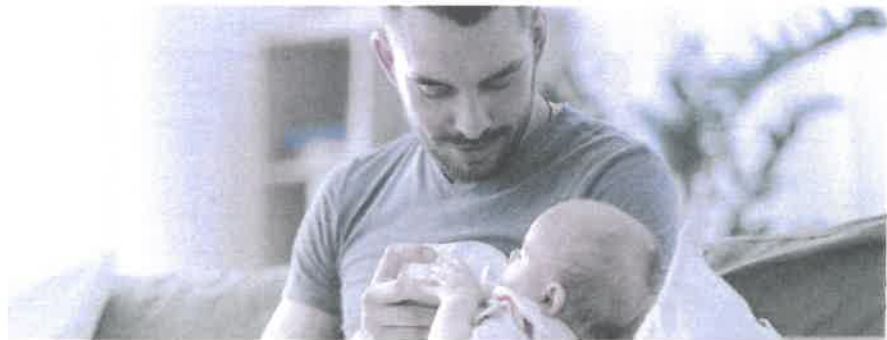
Vaterschaftsurlaub: innert sechs Monaten nach der Geburt zu beziehen.

Das Unternehmen muss dem Vater zehn arbeitsfreie Tage gewähren und hat für diese Zeit Anspruch auf 14 Taggelder. Es ist Sache des Arbeitgebers, bei der Ausgleichskasse – welche auch die EO-Beiträge abrechnet – den Antrag auf die Vaterschaftsentschädigung zu stellen. Der Antrag sollte aber erst gestellt werden, wenn der Arbeitnehmer den ganzen Vaterschaftsurlaub bezogen hat und der Arbeitgeber dies mit dem Antrag bestätigen kann. Die Auszahlung der Vaterschaftsentschädigung erfolgt dann nachgelagert