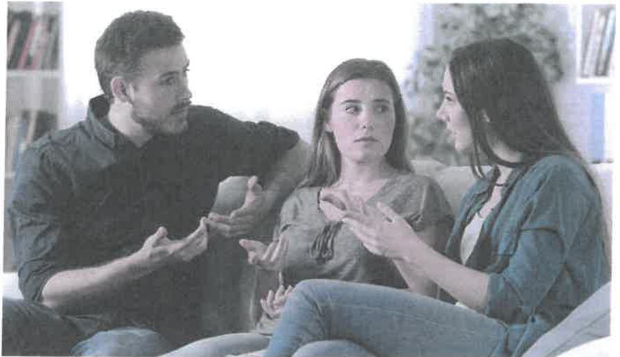
Kommt es zum Streit zwischen den Erben, muss der Willensvollstrecker schlichten.

Der Willensvollstrecker setzt den letzten Willen des Erblassers um. Dafür stellt er als Erstes ein Inventar auf, das er laufend nachführt. Er verwaltet die Erbschaft bis zur Teilung und muss darauf achten, dass das Vermögen erhalten bleibt. Er bezahlt die Schulden des Erblassers inklusive der Todesfallkosten und treibt offene Forderungen ein. Zur Verwaltung gehören auch die laufenden Geschäfte, beispielsweise muss er sich um den Unterhalt von Liegenschaften kümmern, laufende Verträge kündigen oder allenfalls die Liquidation einer Einzelunternehmung umsetzen. Er ist verantwortlich für die Erstellung der