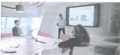
Gute Nachrichten: sinkende Abgaben für die Privathaushalte und die grosse Mehrheit der Unternehmen.

Faktenblatt zur Radio- und Fernsehgebühr ab 2021: https://bit.ly/2KwyzCc